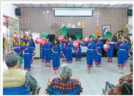
內埔育英國小客家舞

迦南以「深耕地方，造福社區」為願景，因此協助了很多好事成真，無私地轉介資源給佳義國小買比賽弓箭、新生國小買大提琴、泰安國小買森巴鼓，還有幫育英國小和長興國小的學童換新鞋；學校也啟發了回饋活動，佳義、育英和長興國小的師生到本院表演，而新生國小的樂音社和泰安國小森巴鼓隊將在1月24日迦南第五屆「迎春送暖關懷弱勢」慈善活動為弱勢鄉民演出。