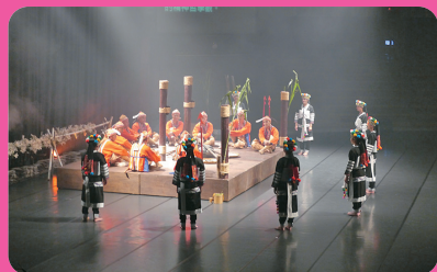
台灣原住民文化園區 (離迦南 11 公里)