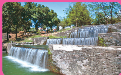
屏東科技大學 (離迦南 100 公尺)

鼓勵善心人士親自到迦南買，一、實際互動才能讓冰棒老闆感受到成就；二、參觀迦南；三、鄰近有很棒的觀光景點！歡迎到屏東！