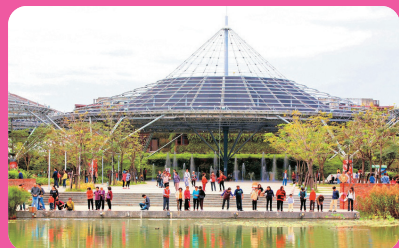
六堆客家文化園區 (離迦南 7 公里)