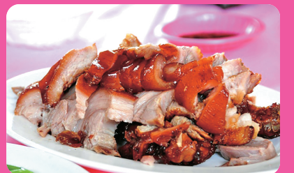
萬巒豬腳 (離迦南 11 公里)