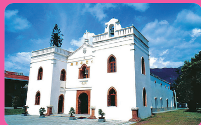
萬金聖母聖殿 (離迦南 9 公里)