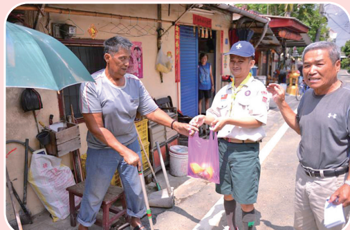
端午送好呷的愛心 獨居老人足感心