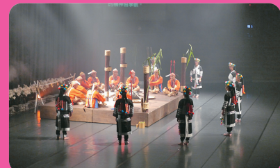
台灣原住民文化園區 (離迦南 11 公里)