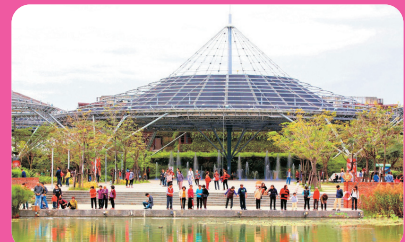
六堆客家文化園區 (離迦南 7 公里)