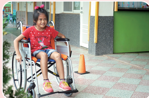
與偏遠國小合辦 身障體驗活動