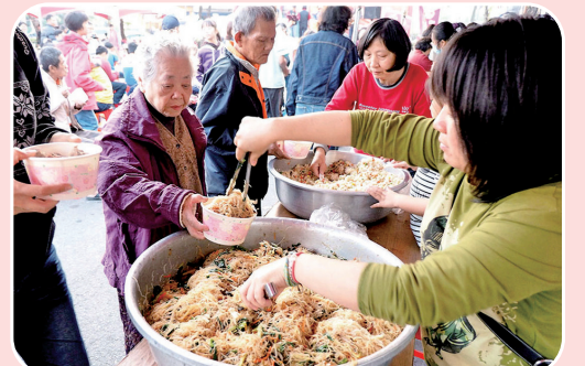
迎春送暖愛心尾牙關弱勢居民 第7屆場次民國106年1月15日