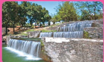
屏東科技大學 (離迦南 100 公尺)

鼓勵善心人士到迦南關懷，實際與老憨兒互動！鄰近還有很棒的觀光景點，歡迎到屏東來玩！