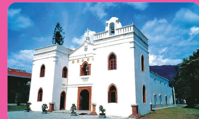
萬金聖母聖殿 (離迦南 9 公里)