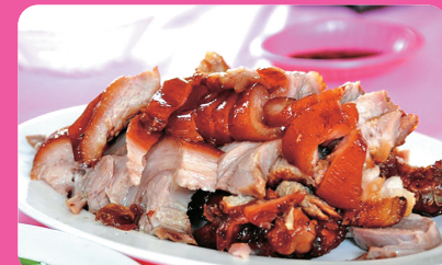
萬崙豬腳 (離迦南 11 公里)