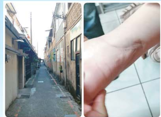
日後會輔導哥哥去辦理相關社會福利補助事宜。」

12月21日杜主任要到新北市，就順便停留在苗栗某小弄訪視等待個案。64年次多重障礙妹妹與七十多歲的母親及一百歲的父親一起住！年老阿母說：「我們都老了，不知道什麼時候會死，我們死了，她怎麼辦？老人院、護理之家都不收，身障的也不收，連政府經營的也不收。難道要我們大家一起走嗎？」 妹妹重度智能障礙，小時候發生了意外，所以走路不穩，易跌倒，但是在小空間，有障礙物可以扶持，就可以正常行動了。主任陪伴他們半小時，走之前給了他們期待的答案：「迦南歡迎妹妹，不過要等待女生床位，父親也可順便排床位哦，日後會輔導哥哥去辦理相關社會福利補助事宜。」