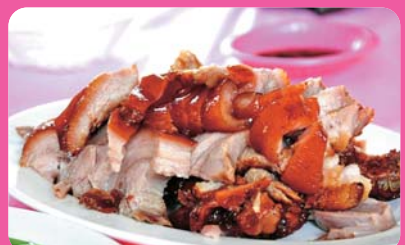
萬崙豬腳 (離迦南 11 公里)