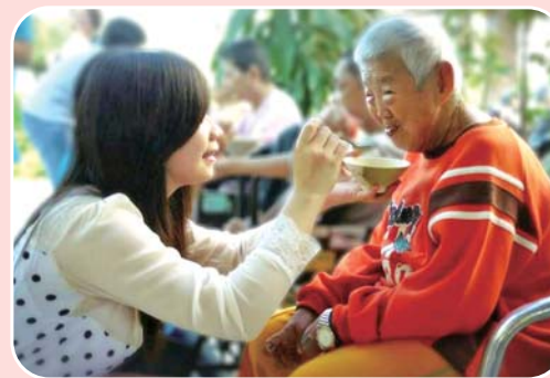
安排國小至大學生關懷活動 培養對身障者有愛無礙