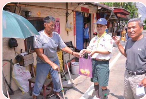
端午送好呷的愛心 獨居老人足感心