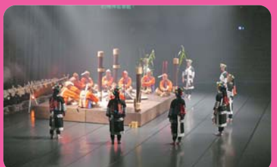
台灣原住民文化園區 (離迦南 11 公里)