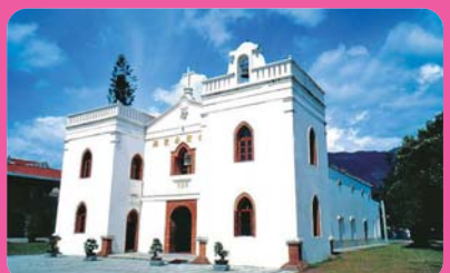
萬金聖母聖殿 (離迦南 9 公里)