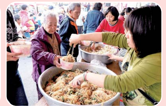
迎春送暖愛心尾牙關弱勢居民 第7屆場次民國106年1月15日