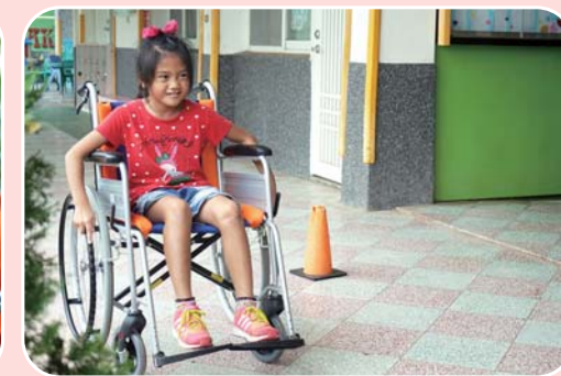
與偏遠國小合辦 身障體驗活動