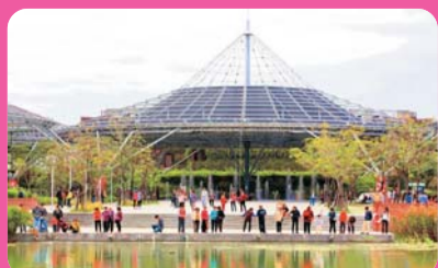
六堆客家文化園區 (離迦南7公里)