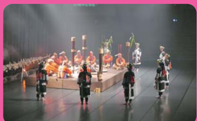
台灣原住民文化園區 (離迦南11公里)