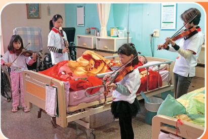
安排國小至大學生 關懷活動培養對身 障者有愛無礙