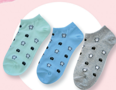
『滿足愛』襪襪3入組 $199元