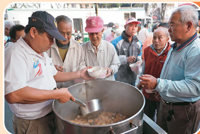
第8屆迎春送暖愛心 尾牙關懷弱勢居民場 次民國107年1月21日