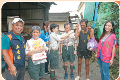
端午送好呷的愛心 獨居老人足感心